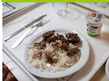
Riz à St-Genès-Champanelle

4 écoles, 784 enfants enquêtés de 6 à 11 ans