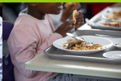
Petites pâtes à Clermont-Ferrand