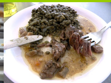
Lentilles vertes à Romagnat